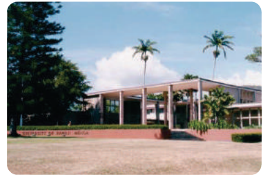
ハワイ大学(マノア校)

備考 * 参加決定後に提携する旅行会社に申し込んで、羽田空港ーホノルル空港往復国際航空券を購入していただきます。(15万円を超えることはありません。) * 宿泊代、保険料は、当財団でお支払いします。(海外旅行傷害保険に加入していただきます。) * 次のものは個人負担していただきます。 ● 食事代 (昼食・夕食それぞれ3回と、土日については個人負担していただきます。それ以外の昼食・夕食、また簡単な朝食は当財団で準備します。) ● 自由行動にかかる費用 ● パスポートの取得、ESTA申請にかかる費用(未取得・未認証の方のみ) ● 自宅から羽田空港までの往復交通費 ● その他現地での小遣い等 * 日本発着空港は「羽田空港」となります。 * セミナー参加に際して特別な配慮を要する場合は、選考後に費用等、参加に向けての協議をさせていただきます。 * オリエンテーション(出発準備ガイダンス)を12月に都内で行います。 * セミナー終了後に報告書(レポート)を提出していただきます。 * 個人情報の取扱いについて 参加申込書にご記入いただいた内容は、当セミナー選考委員による選考、当財団からご本人および指導教員への連絡以外には使用しません。なお、参加決定者については「本人氏名・学校・学部・学科・年次」「指導教員氏名」を講師・スタッフ・参加学生等のセミナー関係者に公表します。予めご了承ください。